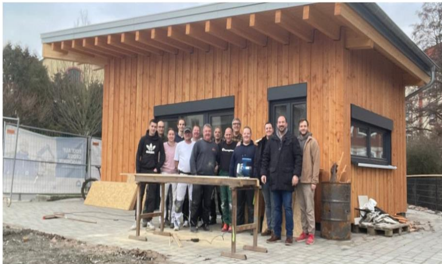
Bürgermeister Nikolaos Stavridis zusammen mit freiwillig Helfenden, die sich um den Innenausbau des Veranstaltungsgebäudes am neugestalteten Drobollacher Platz kümmern.

Das gesamtkommunale Zusammenleben gefördert wird. Traditionen, Feste und das ehrenamtliche Engagement sollen wieder eine Wertschätzung erfahren.