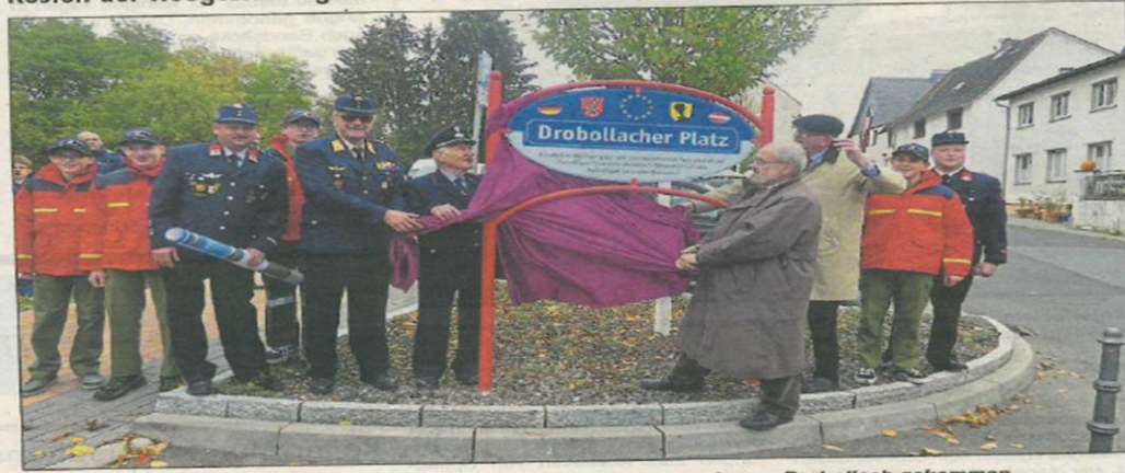
Zur Platzeinweihung waren auch Feuerwehrleute der Partnerfeuerwehr aus Drobollach gekommen.

Kosten der Neugestaltung des Drobollacher Platzes betragen circa 520.000 Euro