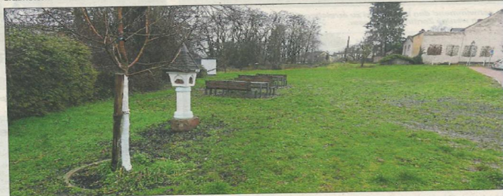
Blick auf den Drobollacher Platz, wie er sich gegenwärtig dem Betrachter bietet.

ansatz 2020 ausgewiesenen Mitteln in Höhe von 405.000 Euro bereits 19.000 Euro für Vermessungs- und Ingenieurleistungen verausgabt wurden, stehen noch 386.000 Euro für das Projekt zur Verfügung. Für den fehlenden Rest sollen überplanmäßige Haushaltsmittel in Höhe von 134.000 Euro im Vorgriff auf einen eventuellen Nachtragshaushalt bereitgestellt werden. Um an Fördermittel aus dem Leader-Programm zu gelangen, bereitet die Verwaltung einen Antrag auf Projektförderung beim Zweckverband Rheingau vor. Weitere Projektförderungen, wie unter anderem aus dem Aktionsplan für den ländlichen Raum oder der Dorferneuerung, sollen nach einer Förderzusage gestellt werden.